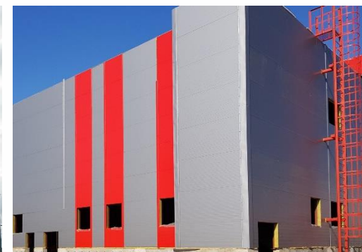
Административно-складской комплекс (РФ, Московская обл., 2019)