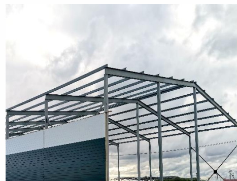
Складские комплексы в индустриальном парке «Федоровское» (РФ, 2018-2022)