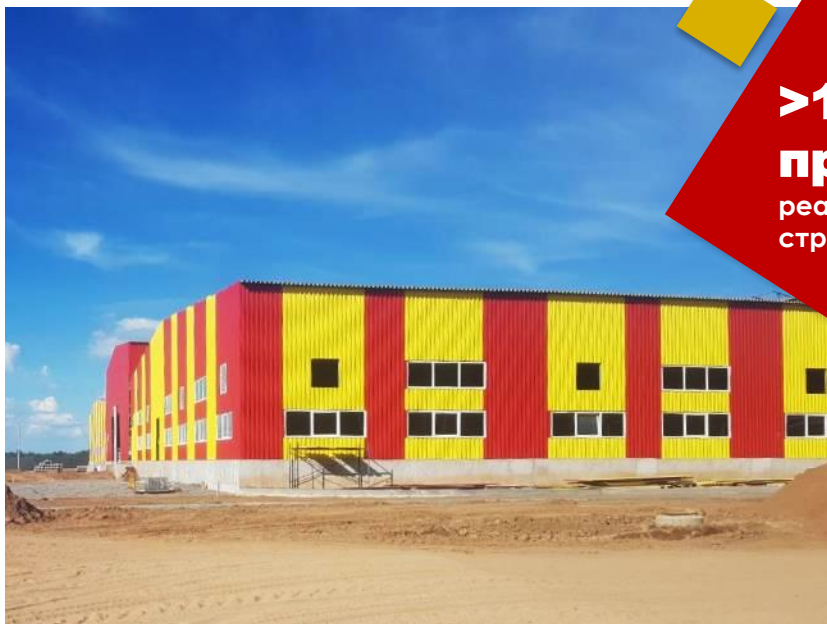
Цех по производству шаровых кранов компании ADL (РФ., Московская обл., 2022)